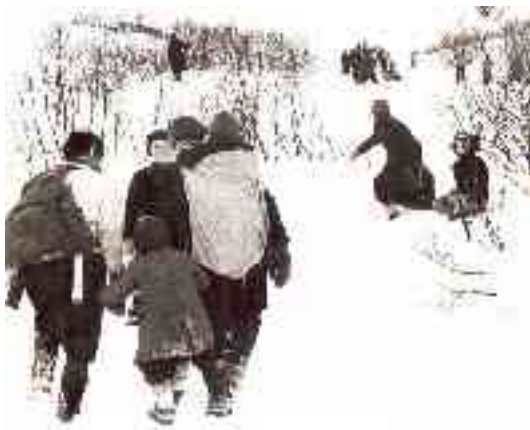
Báhtareaddjit jodus Sáttovuonbáhtii 1945 guovvamánu. Doppe bohte fatnasat mat válde sin fárrui Skotlandii.