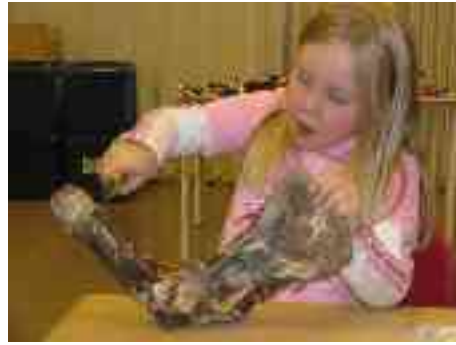
- Gal mun boran!