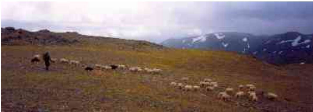
Mán̄ga jagi johte sávzzaiguin Duorppalvuona ja Ákñoluovtta gaskkas.