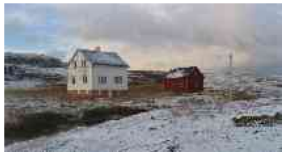
Muhto mán̄ga dálu leat dál báhcan guorusin.