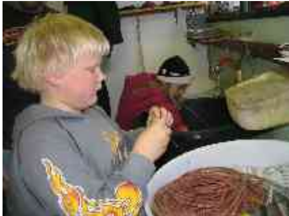
Mii leat seaktán liinna.