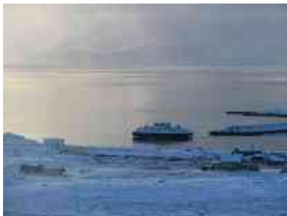
Moadde háve juohke beaivvi manná fearga Ákšovutnii.