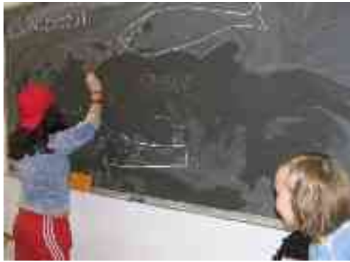
Mii čállit ja sárgut