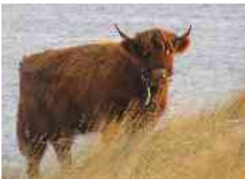
Dáppe leat muhtin gusat maid