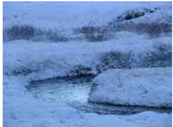
- ja jogaža