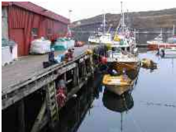
Bivddiimet guliid kájas.