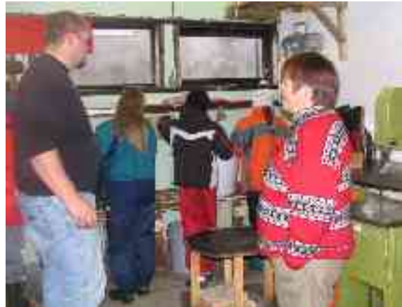
Oahpaheaddjit gehččet go oahppit sektet