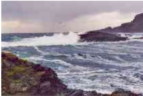
Dáppe sáhtttá leat garra bieggá