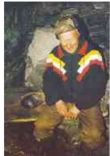
Dát lei sin hivsset