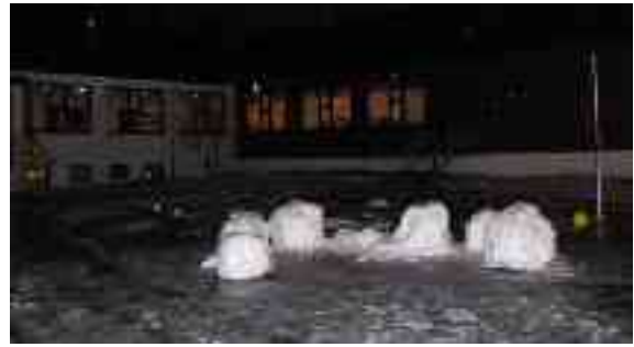
Muohtá, muhto beaivi maŋŋá de arvá fas ja min muohtaráhkadusat suddet.