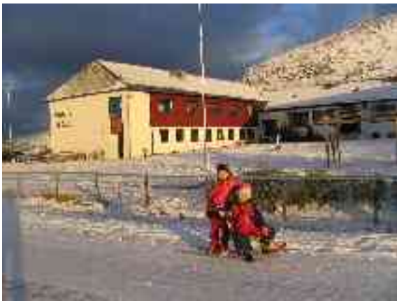
Skuvllas leat 10 klássa ja 75 oahppi.