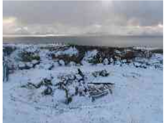
Soadiáigge hukse duiskkalaččat stuora latniid Hoavvai.

1944 čakča bolde duiskkalaččat buot viesuid Ákŋoluovtta suohkanis, dušše Gáltta girku bázii.