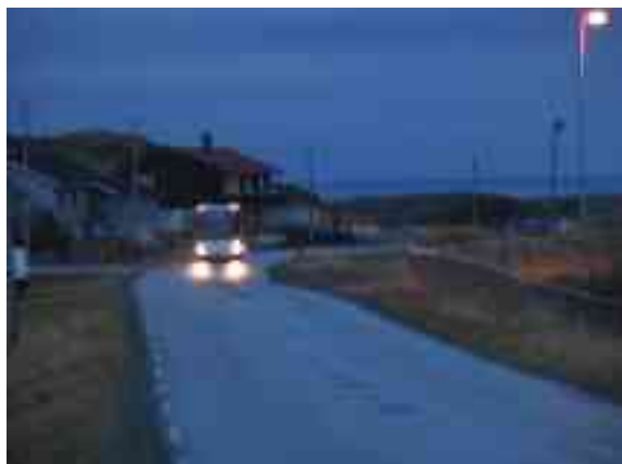
Árrat idedis bohtet nuoraidskuvlaoahppit skuvlabussiin Gohteluovttas Ákņoluktii.