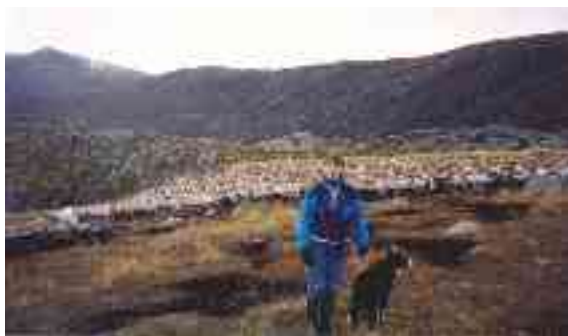
Eallu lea gárddis