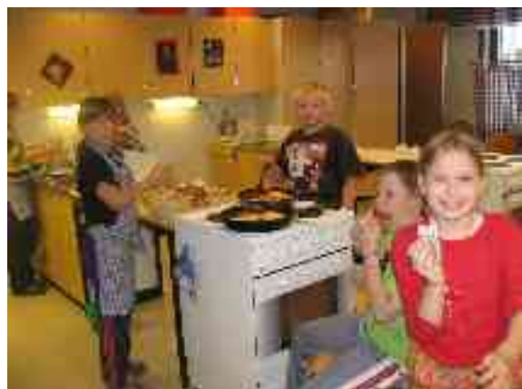
Liinnas maid sevttiimet bivde ollu jusku ja das ráhkadeimmet guollegáhkuid