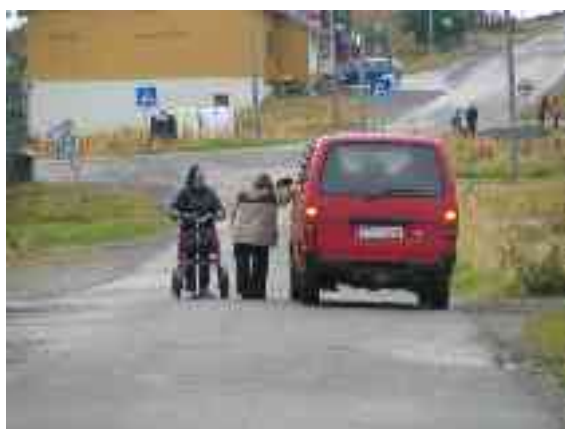
ja eará veahkeneavvut.