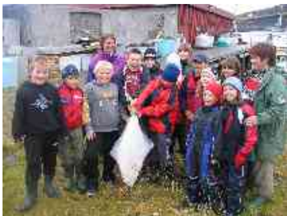
- ja stuora báldá