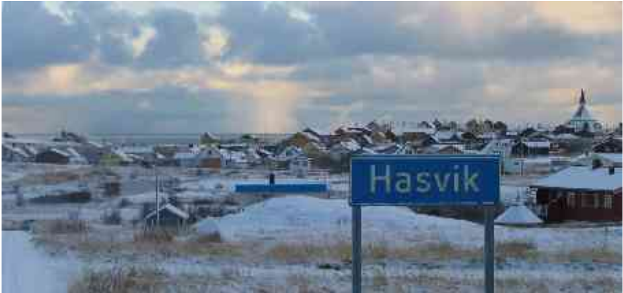
Lea buorre orrut Ákñoluovttas. Dáppe orrot sullii 400 olbmo.