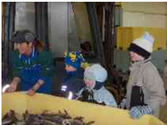
Gohteluovtta skuvlla oahppit fitnet guolleindustriijas.