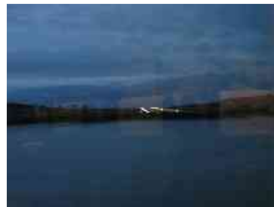
Girdit girdet Ákņoluovtta girdišilljus Hammerfestii ja Romsii