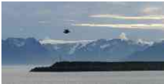
Ákŋoluovttas sáhtta oaidnit jieki mii lea nannámis