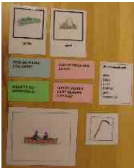
Muhtin koarttat min spealuin