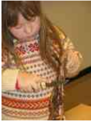
- Borat go goikebiegggu?