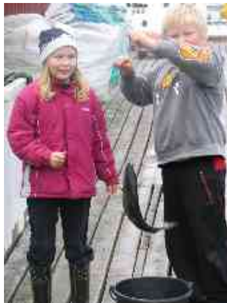
Doppe gottiimet moadde sáiddi