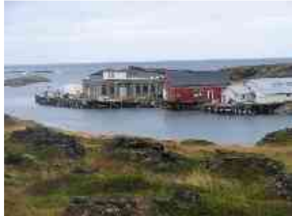
Ákŋovágis lea leamaš guolleindustriija