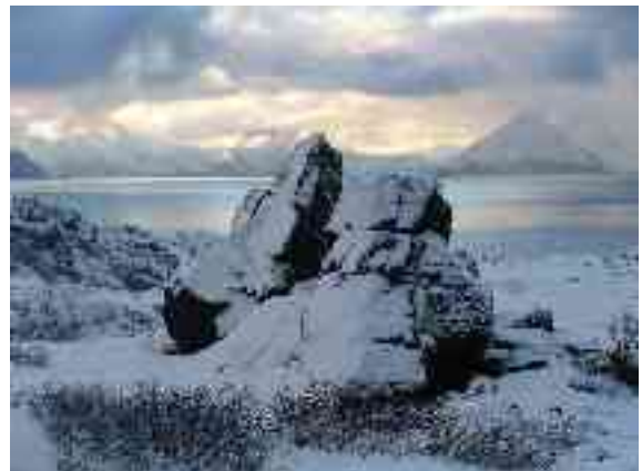
Lei go dát stuora geađgi sieidi dološ áiggis?