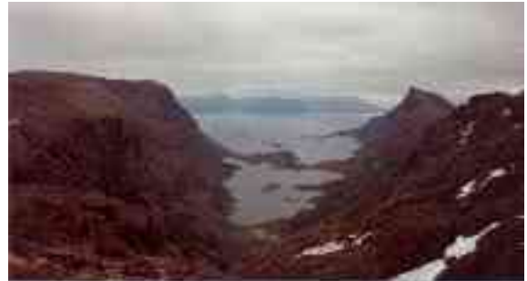
Gáhpivuonas lea stuora jávri