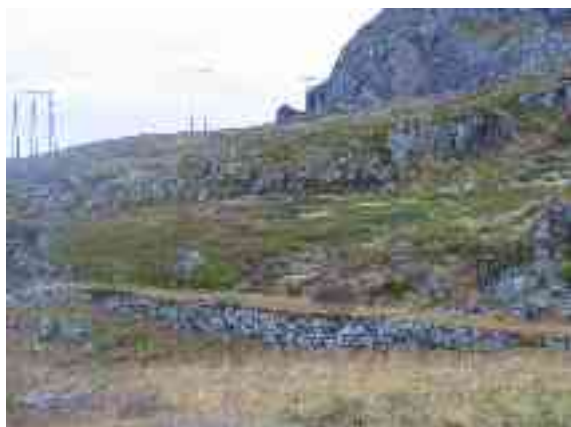
Ain sáhtta oaidnit boares luotta Ákņoluovtta ja Ákņovági gaskkas