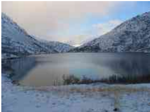
Sállanis leat mánga jávri