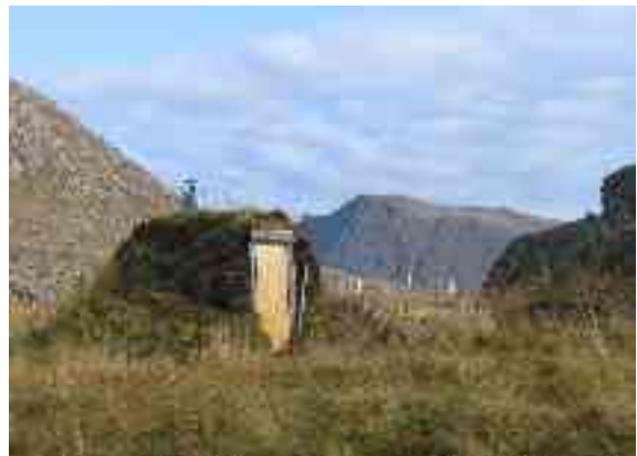
Skuvllas lea goahti, maid oahppit ja oahpaheaddjit ieža leat huksen