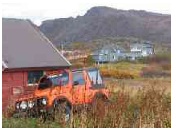
Gávdnójit dáppe mángalágan biillat