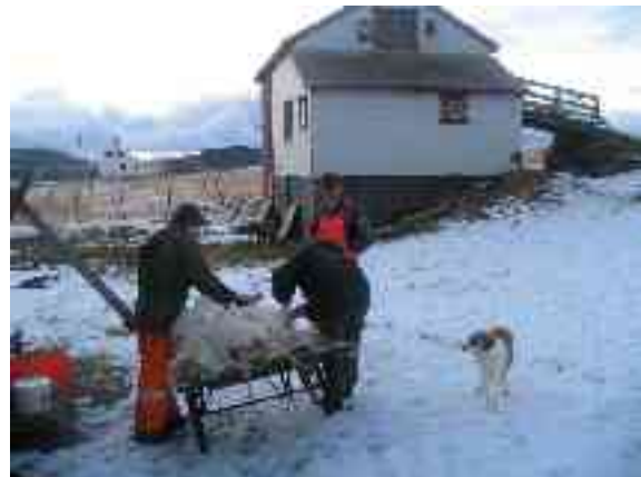
ja Ákñovágis njuvvet ruovttus