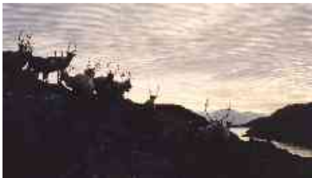
Bohccot vári alde

Gaskasiida fievrída fatnasiin Duorppalvuonas Ráirui ja de johtet Iešjávrrí ja Šuoššjávrrí bokte. Oarjesiida fas fievrída fatnasiin Ákŋovuonas Šuovusluktii ja johtet Suolovuomi ja Láhpoluobbala bokte. Eanaš boazoeaiggát johttet ealuid mielde ja orrot dálvet Guovdageainnus ja Mázes, muhto maiddá muhtin olbmui, geat orrot Sállanis birra jagi, leat bohccot sihke gaskasiiddas ja oarjesiiddas.