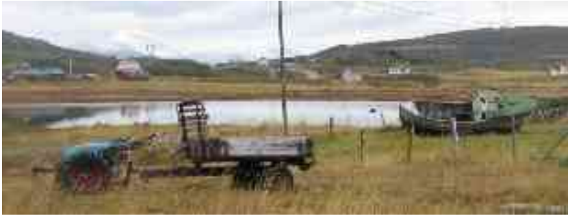
Dološ áiggi elle olbmot dáppe šibitdoalus ja guolásteamis