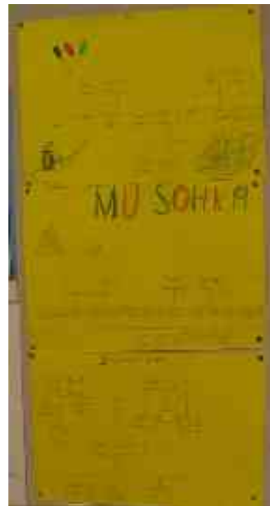
Mii leat sárgon sohka muoraid