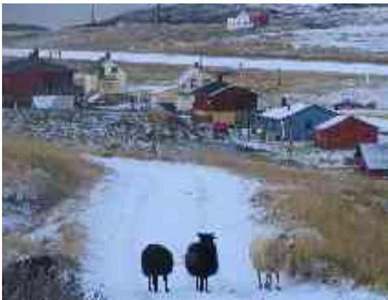
Ain leat sávzzat Ákñoluovttas