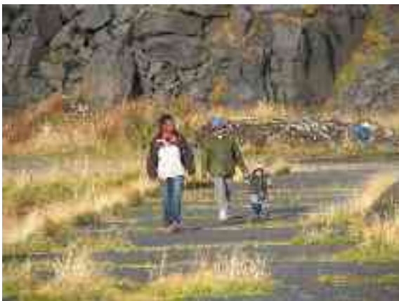
Deike leat bohtán olbmot mángga riikkas