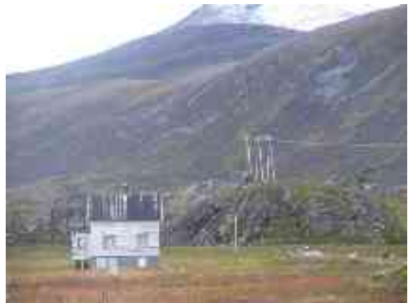
-- muhto mánggas leat fárren eret ja guoddán guorus viesuid