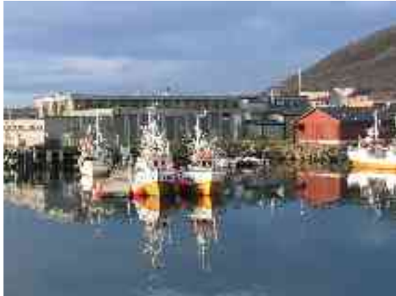
Ákŋoluovttas lea leamaš reahkafabrihka

Eanaš fitnodagat leat dál heitihuvvon. 2002 reastaluvai fitnodat mas ledje fabrihkat sihke Mearragohpis, Gohteluovttas ja Ákŋoluovttas. Badjel 100 olbmo másse dalle bargguset, ja dál eai leat oktiibuot eambo go sullii 40 bargosaji guollebuvttadasas.