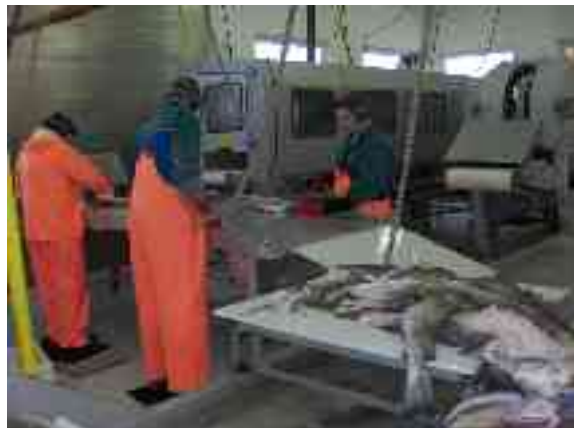
Gohteluovtta guolleindustriijas čollet guliid.