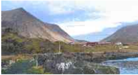
Mearas ii leat guhkás alla váriide