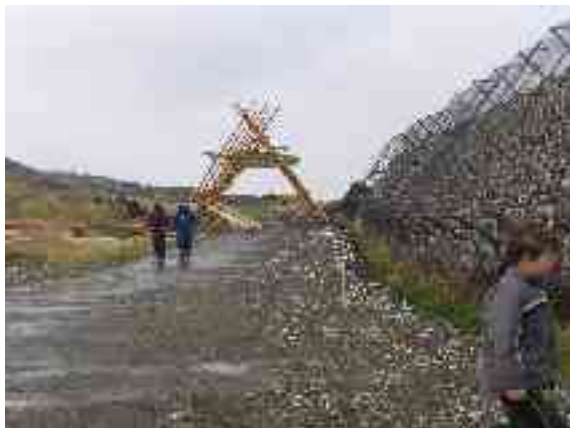
Dál fertejit goikadit guoli, go fabrihka ii šat jiekŋut guliid.