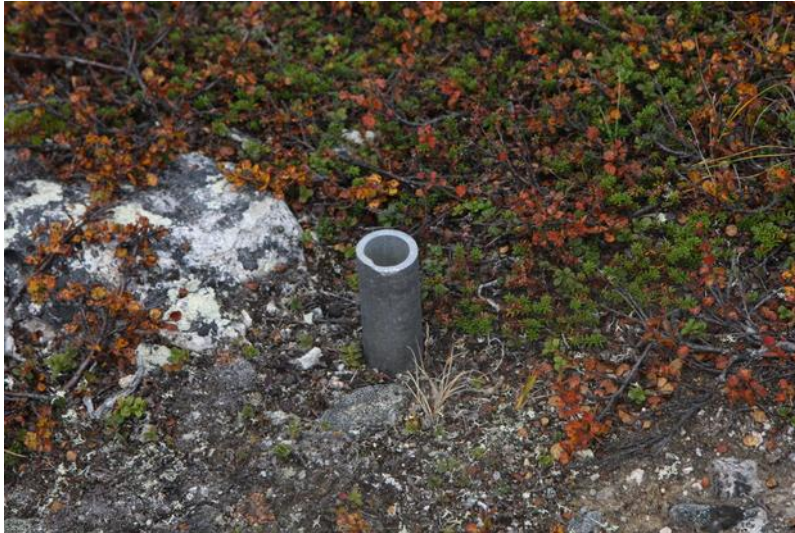
Rør som stikk opp av bakken etter prøveboring i samband med plan om gjenoppstart av Bidjovagge Gruber. I terrenget står det framleis ei rekke slike rør, dei fleste rusta og mye høgare.

Det neste er sprenginga. Ved dagbrot spreier fint mineralstøv seg i terrenget, ofte langt utafor gruva, der det legg seg over planter, som igjen etast av dyr, som også pustar inn luft med mineralstøv i. Det er så vidt eg veit ikkje gjort mye undersøkingar på dette, men ved koppargruvene i Kvalsund på 1970-talet blei det konstantert av Statens veterinære laboratorium at rein som beita nær gruva hadde døydd av lungebetennelse.