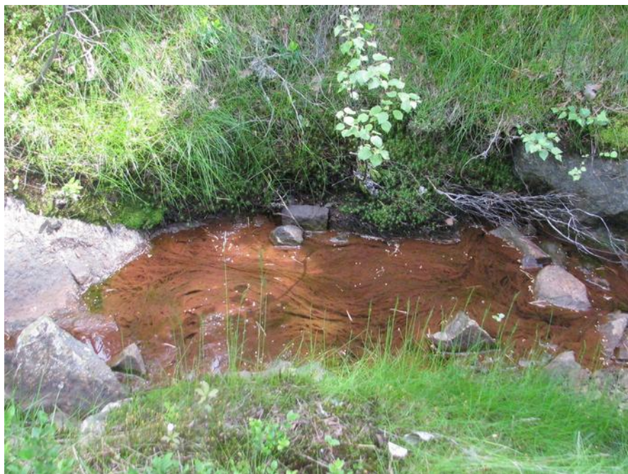
Bekk ved nedlagte Flot nikkelgruve, Evje i Agder.

I Noreg er ei mengde vassdrag forureina av utslepp frå kisgruver, og nokre elver er framleis fiskelause lenge etter at gruva er nedlagt. Dei fleste tenker at det går no over med tida. Men igjen: Ingen ting forsvinn. Forureininga blir i beste fall spreidd. Ho får mindre akutt verknad nær utsleppa, men samtidig mindre verknad over eit større område. I Frankrike er det gjort undersøkingar som viser at verknadane av omlag tusen år gamal gruvedrift framleis kan målast i jordsmonnet nær gruva.