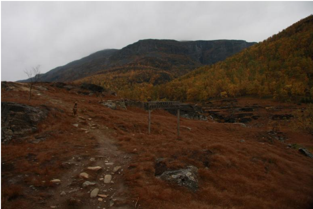
Ankerlia friluftsmuseum viser restene av smelteverket etter koppargruvene i Biertavárri, Kåfjord i Troms. Bildet er tatt nesten hundre år etter at drifta blei lagt ned, men forstasatt vokser det svært lite i området nær ruinene av smelteverket.

Når konsentratet er skilt ut, gjenstår dei delane av malmen som gruveselskapet ikkje har funne noko lønsam bruk av. Det vil ikkje seie at desse minerala ikkje kan brukast til noko, men at gruveselskapa under noverande økonomiske og politiske vilkår verken finn det lønsamt å utnytte dei, eller blir pålagt å gjøre det. Desse vilkåra er i stor grad fastsett av styresmaktene, bl.a. at uttak og utslepp i