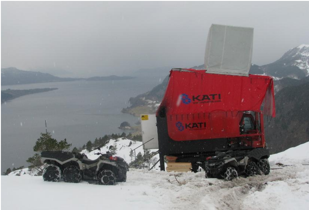
Frå toppen av Engebøfjellet med utsikt utover Førdefjorden. Her pågikk prøveboring vinteren 2018. Staden der bildet blir tatt vil være borte om nokon år og endra til eit djupt dagbrot. Mountain top removal på norsk.