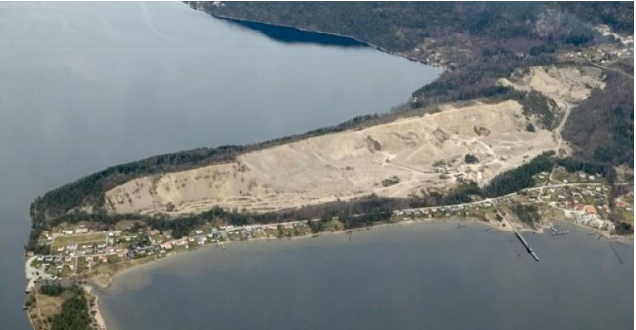
Dette bildet fra Hurum i Buskerud viser kor mye eit sandtak kan endre eit landskap og påverke natur og bumiljø.

I mange år var underjordsgruver så dominerande at dei fleste av oss i første rekke tenker på dei når vi snakkar om gruver. Underjordsgruvane hadde mange fordelar. Ressursøkonomisk ga dei langt mindre berguttak pr. tonn malm enn dagbrot, dei ga muligheit for å drive året rundt uavhengig av vind og vær og sjølve gruva førte til relativt lite endringar i landskapet på overflata. Likevel har utviklinga gått meir og meir i retning av dagbrot. Desse har sine konkurransefordelar med at det kan drivast med langt større maskinar, både for boring/sprenging og transport av utsprengt stein til oppreiingsanlegg eller gråbergdeponi. I verdsrålestokk er no 8 av dei 10 største gullgruvane dagbrot. Noko tilsvarande er tilfelle for mange andre metall. På heimebane har vi hatt denne konflikten bl.a. ved Sydvaranger. Som dei fleste gruver starta ho som dagbrot, og så har det gong på gong vore starta arbeid med å gå over til underjordsdrift. Kvar gong har det kome nye og større maskinar, og ein har vald å satse vidare på dagbrot likevel. Kombinert med ønsket om å tene mest mogleg på kort sikt, har det ført gruva opp i ein situasjon der mindre og mindre del av det som sprengast ut er mineral som kan brukast i produksjonen.