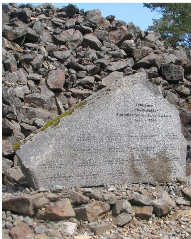
Minnesmerke ved Flot nikkelgruver, Evje i Agder over dei 18 som omkom i arbeidslukker i tida 1872-1948.

Ved mange gruver, både nedlagte og igangverande, står det minnesmerke over dei som mista livet under arbeid i gruva. Nokre eksempel er Titania, Flåt, Knaben.