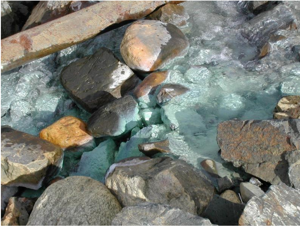
Frå Biedjovággi, 15 år etter nedleggjing av gruvedrifta.