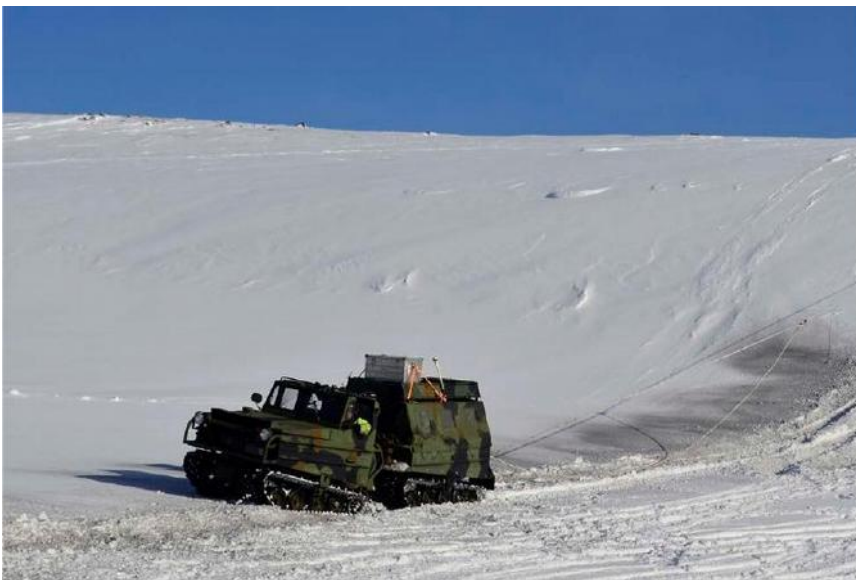
Denne bandvogna, som forøvrig ser meir militær enn sivil ut, kjørte over Finnmarksvidda og sprengte seismikk, som blei avlest av målarar som blei slepa etter. Verknadane for dyrelivet er ikkje kartlagt.

Det startar allereie i kartleggingsfasen. Først gjør NGU og tilsvarande institusjonar målingar frå lågflygande fly og helikopter, og sprenger seismikk frå terrengekjøretøy, så kjører dei og gruveselskap i terrenget med store boremaskinar, og etter dei står spor og rør etter boringa.