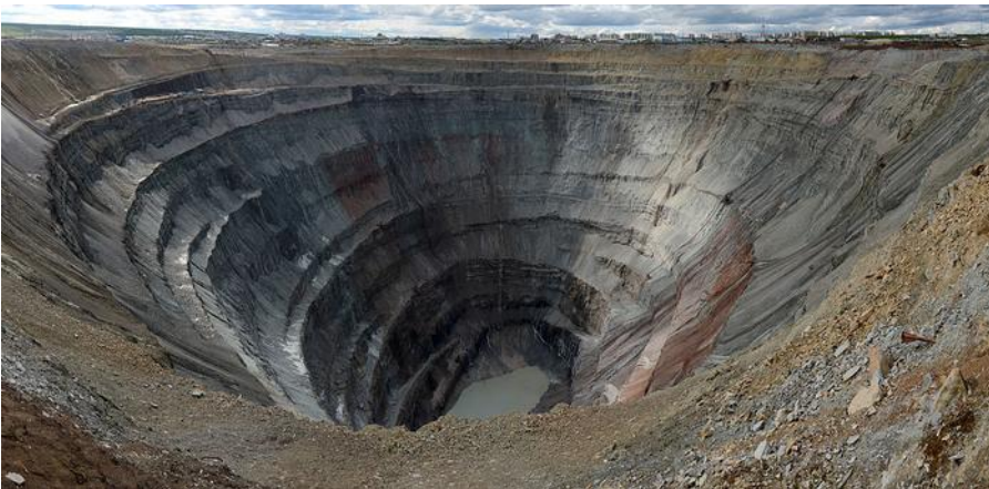
Eit av verdas største hol er diamantgruva Mir i Jakutia i Sibir. Merk blokkene som ligg på kanten bak til høgre.

I mange år var underjordsgruver så dominerande at dei fleste av oss i første rekke tenker på dei når vi snakkar om gruver. Underjordsgruvane hadde mange fordelar. Ressursøkonomisk ga dei langt mindre berguttak pr. tonn malm enn dagbrot, dei ga muligheit for å drive året rundt uavhengig av vind og vær og sjølve gruva førte til relativt lite endringar i landskapet på overflata. Likevel har utviklinga gått meir og meir i retning av dagbrot. Desse har sine konkurransefordelar med at det kan drivast med langt større maskinar, både for boring/sprenging og transport av utsprengt stein til oppreiingsanlegg eller gråbergdeponi. I verdsrålestokk er no 8 av dei 10 største gullgruvane dagbrot. Noko tilsvarande er tilfelle for mange andre metall. På heimebane har vi hatt denne konflikten bl.a. ved Sydvaranger. Som dei fleste gruver starta ho som dagbrot, og så har det gong på gong vore starta arbeid med å gå over til underjordsdrift. Kvar gong har det kome nye og større maskinar, og ein har vald å satse vidare på dagbrot likevel. Kombinert med ønsket om å tene mest mogleg på kort sikt, har det ført gruva opp i ein situasjon der mindre og mindre del av det som sprengast ut er mineral som kan brukast i produksjonen.