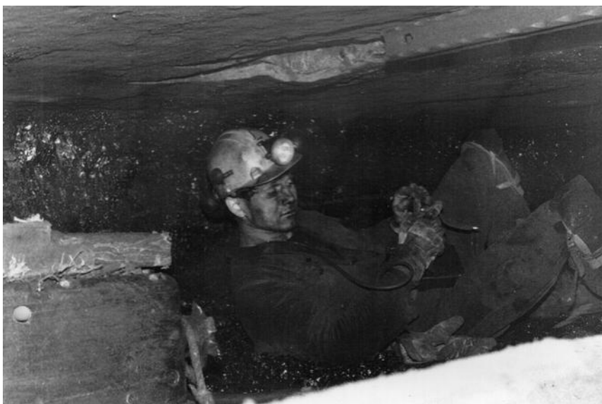
Kolgruvarbeidar på stollen. Gruve 3, Longyearbyen, 1986.

Kva som skal reknast til mineralnæringa i dag, kan absolutt diskuteras. Vi ser for oss den klassiske gruvarbeidar med hovudlykt som i lag med arbeidskameratane tar heisen fleire hundre meter ned for å bore i 8 timar før han igjen får komme opp i dagen. Og framleis er sjølve det å bore og sprengje laus berg ein sentral del av mineralnæringa, men mens dei som driv direkte på malmen blir relativt færre, blir det fleire som overvakar automatiske prosessar over data, som produserer og reparerer utstyr, og som transporterer malm og mineralar vidare. Nokre bygger og vedlikeheld deponi for gruveavgang, andre driv kjemisk overvaking av utslepp. Og sett som kapitalistisk verksemd, inneheld også mineralnæringa funksjonar som rekneskap, aksjespekulasjon, konsulentverksemd og marknadsføring. I tillegg til at større mineralselskap har eigne informasjonskonsulentar eller PR-folk, er det ei heil næring bare i det å marknadsføre mineralnæringa som heilskap, og framstille denne som samfunnsmessig viktig, miljøvenlig, bærekraftig osv. Mineralutvinning og tilknytte verksemd er arbeid som krev kunnskap og ferdigheiter. Opplæring for dette i skole og bedrift er dermed nødvendig for næringa.