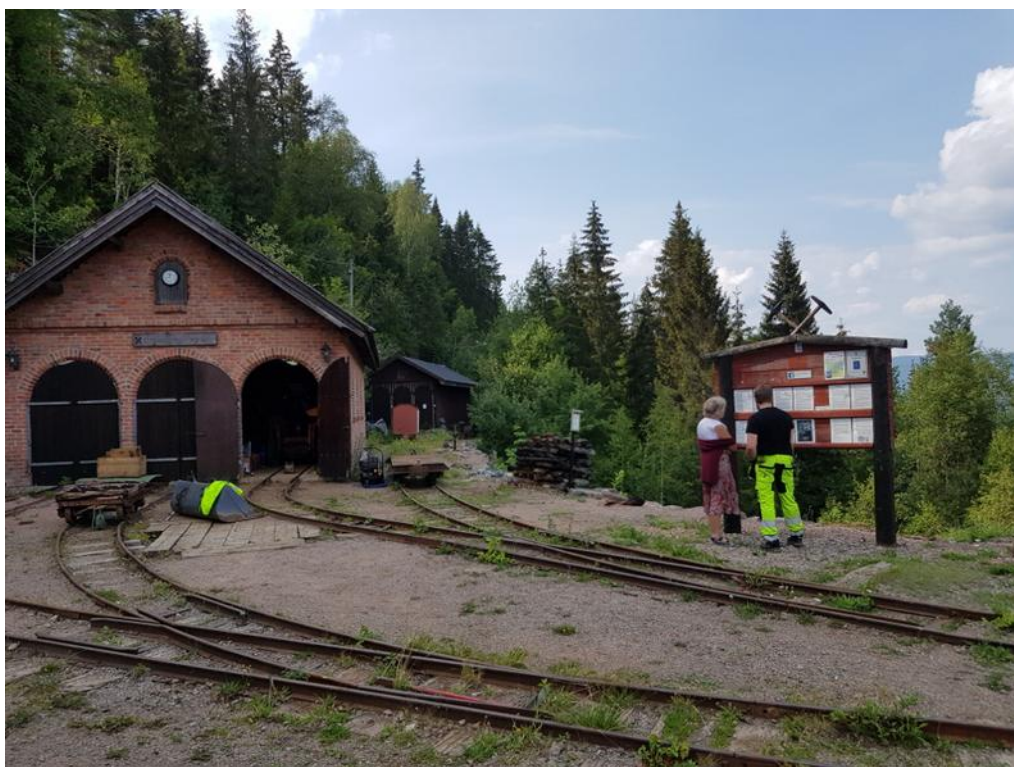
Eit gruvemuseum under oppbygging: Konnerud gruver, Drammen.

Fleire stadar er det lokale entusiastar som har sett igang det som seinare har blitt eller kan bli gruvemuseum. Eit eksempel er Konnerud i Drammen, eit anna Lovise smeltehytte i Alvdal.