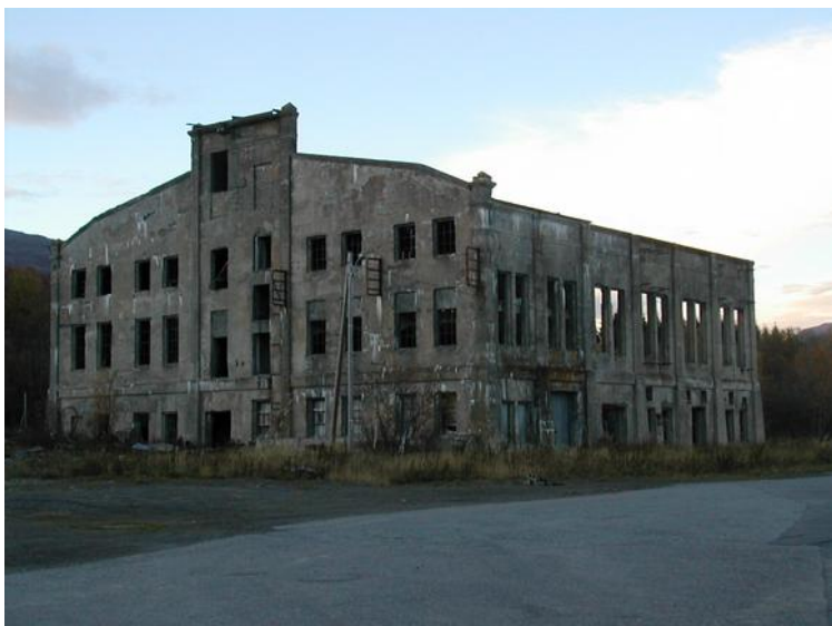
Ruin etter driftsbygning på Salangsverket. Gruva blei starta i 1907 og nedlagt i 1912. Bildet er tatt omlag