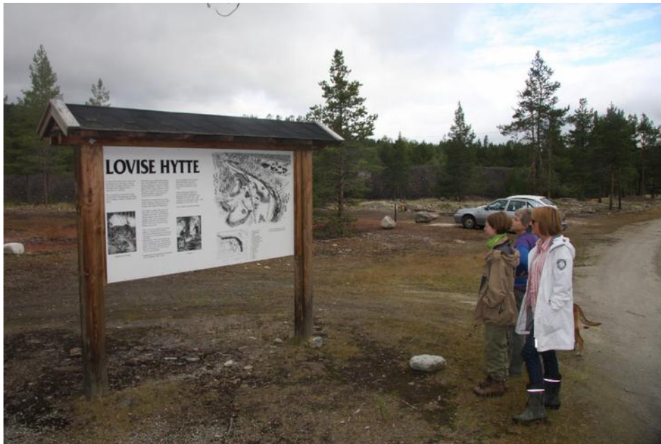
Ved ruinane etter Lovise hytte, som frå 1748 var smelteverk for ei rekke kobbergruver, har lokale entusiastar sett opp informasjon.

Eit eksempel på lokalt initiativ er Guovdageainnu Meahcceguovddáš, altså natursenteret i Guovdageaidnu, som eg har vore med å sette i gang. Vi har som mål å vise natur, naturbruk og naturinngrep. Til det siste hører den kjente Altautbygginga og lokal mineralutvinning og mineralleiting. Vi har laga utstillingar om Biedjovággi gruver og Náránaš steinbrot, som viser historia om drifta og verknadar på naturen.