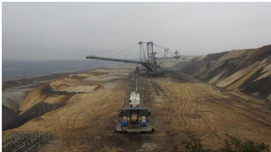
Brunkoldagbrotet i Belchatów i Polen er eit av verdas største. Det er omlag 3 km breitt og nesten 20 km langt.

I verdsmålestokk er kol det mineralet som blir tatt ut aller mest av. Kwart år blir det tatt ut astronomiske 7-8 milliardar tonn, og det aller meste blir brent og går ut i atmosfæren som karbondioksyd, CO 2 . Kolutvinning er trulig og det som fører til størst landskapsendringar. Dei fleste tenker på kolgruver som underjordsgruver, og mange er det, som på Svalbard. Nokre stadar som sør i Polen, blir kolet tatt ut over 1000 meter djupt. Uttaket synest da ikkje på overflata, men det blir likevel ganske store mengder med avgang som ikkje kan brukast, og som blir lagra i store haugar eller åsar.