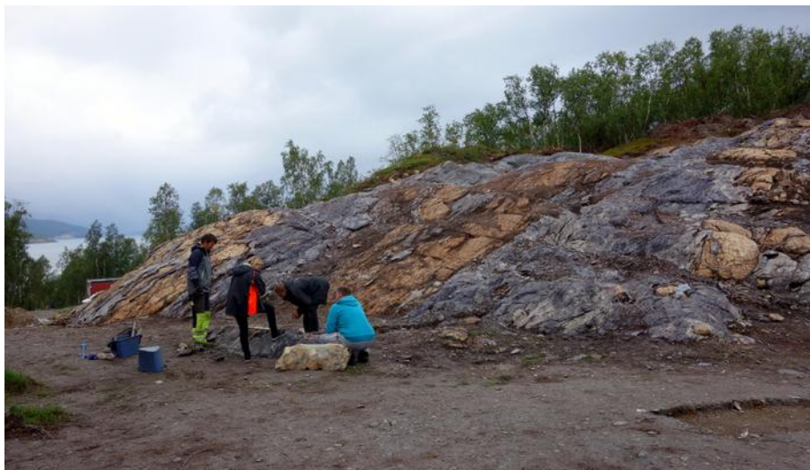
Arkeologisk utgraving av chert-brudd i Alta.

I Europa er det flintgruver framtrekande i eldre historie. I perioden 4000–1200 fvt. var det ei rekke gruver, bl.a. i England, Belgia, Tyskland og Polen. 1 Den nordligaste av desse var heilt sør i Sverige. Av geologiske årsakar var det dårlig med flint lenger nord, einaste var at ein i steinalderen enno kunne finne flintknollar på strendene i sør, som etterlatenskapar frå isen trakk seg tilbake etter istida. I Noreg var det andre mineral som skulle bli sentrale for utarbeiding av reiskapar, bl.a. grønnstein, chert og skifer. På Hespriholmen på Bømlo nær Bergen kan vi sjå restar av det som er omtalt som Noregs eldste bergindustri. Her blei det tatt ut grønnstein omlag 7500–2000 f.Kr. og økser og andre reiskapar av denne steinen er finne igjen over store delar av Sør-Noreg. I Noreg er det kjent omlag 50 steinbrot frå steinalderen. I Alta er det kjent heile fem brot av mineralet chert, som liknar på flint og har tilsvarande eigenskapar og bruk. Eit av desse blei funne i 2010 i samband med omlegging av E6. Etter at arkeologar hadde fått grave litt blei så nyvegen lagt tvert over brotet, og i dag er det ingenting igjen å sjå. Det kan stå som eit eksempel på korleis vi i Noreg tar vare på våre geologiske og arkeologiske fortidsminner. Til samanlikning er flintgruver i England og på kontinentet store turistattraksjonar.