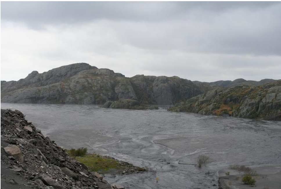
Delar av landdeponiet til Titania.

Hol i fjell etter dagbrot og underjordsgruver, gråberghaugar og avgang plassert i dammar eller direkte i naturen eller i sjøen, vassdrag som er regulerte for å gi vatn til drift av gruvemaskineri (eks. Kongsberg) eller til elektrisk straum for gruver (Sulitjelma)