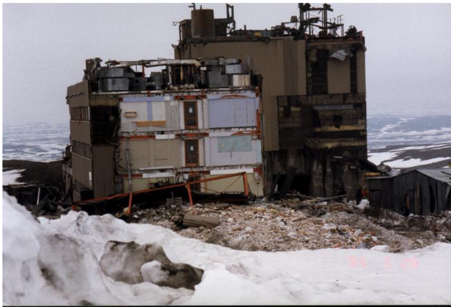
Driftsbygningen til Bidjovagge Gruber under nedrivning, 1995.

Gruva blir formelt nedlagt og sikra med gjerder osv., men gruvegangar og dagbrot blir halde opne, med tanke på at stigande mineralprisar og evt. betre teknologi kan gjøre det lønsamt å ta opp igjen drifta, med lågare "cut-off", altså drive på lågare metallprosent eller på vanskeligare tilgjengelig malm. Ofte er det statlige styresmakter som ikkje ønsker å stoppe muligheita for gjenoppstart. Resultatet kan bli at opne dagbrot og gamle bygningar blir ståande på ubestemt tid, til ingen lenger har ansvar.