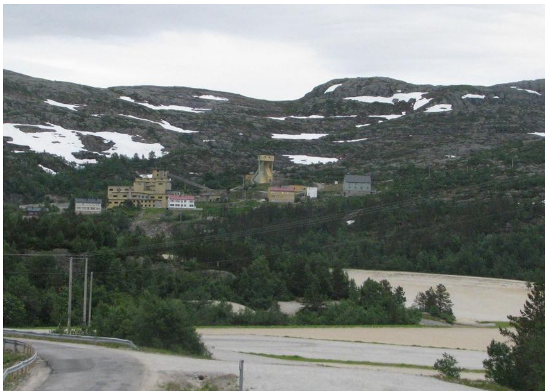
Knaben gruver i Agder, Sanda nederst til høgre i bildet er gruveavgang. Der var tidligare eit vatn, men dette er heilt fylt opp. Resten av sanda er ført med elva nedover og ligg langs elvebredden og på elvebotn.

Dei enorme mengdene med finmalt avgang blei eit problem i første rekke etter at ein tidlig på 1900-talet innførte oppreiingsmetodar som flotasjon og magnetseparasjon. Lenge fikk gruveselskapa sleppe dette ut kor det passa dei best, det vil som regel seie rett ut for oppreiingsverket. Avgangen hamna ut i naturen, blei skylt nedover elver eller blei sleppe ut på stranda av vatn og fjordar. Mengdene blei etter kvart så store at noko måtte gjørast, og ein gikk da over til å bygge dammar, anten med vollar rundt heile eller med utnytting av dalar der ein bare kunne demme i ein ende eller to. Der det var mest praktisk å lagre i vatn eller fjordar, førte ein avgangen ut gjennom lange rør, så han hamna på djupaste staden. Ute av syne, ute av sinn. Korleis straumar og kjemiske reaksjonar førte stoffa vidare, var ikkje gruveselskapa sitt bord. Slik sløsing med ressursar og slik planlagt forureining er gratis i Noreg, og Miljødirektoratet godtar ALLE søknadar om utsleppsløyve.