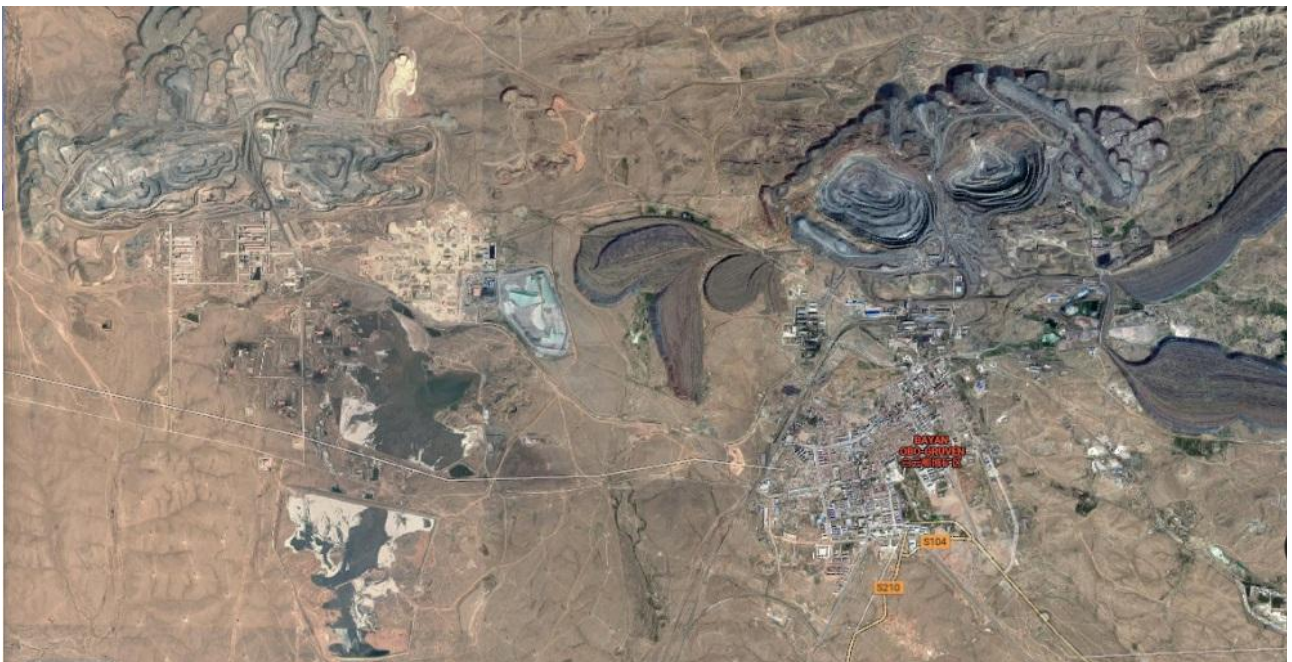
Eksempel på korleis gruver endrar landskap både gjennom dagbrot og avgangamassar. Bayanobo gruvefelt for sjeldne jordmetall, Kina.