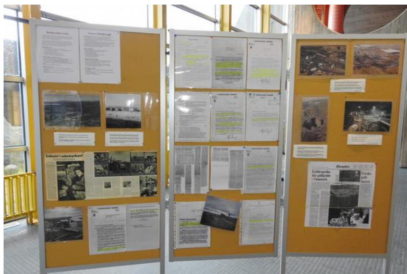
Delar av Guovdageainnu Meahcceguovddáš si utstilling om Biedjovággi gruver. Dette er den eldste del av historia med bilde og dokument frå tida med malmleiting og tidlig drift.

Eit eksempel på lokalt initiativ er Guovdageainnu Meahcceguovddáš, altså natursenteret i Guovdageaidnu, som eg har vore med å sette i gang. Vi har som mål å vise natur, naturbruk og naturinngrep. Til det siste hører den kjente Altautbygginga og lokal mineralutvinning og mineralleiting. Vi har laga utstillingar om Biedjovággi gruver og Náránaš steinbrot, som viser historia om drifta og verknadar på naturen.