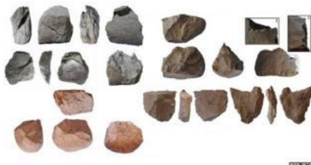
Nokre av dei eldste steinreiskapa som er funne i Afrika, omlag 3 millionar år gamle.

Dei eldste steinreiskapa som er funne er omlag 3,3 millionar år gamle, altså eldre enn det moderne mennesket, Homo sapiens, kanskje enno eldre enn slekta Homo. Og som så mye anna, stammar denne historia frå Afrika. Bilda av desse syner at det er snakk om å utnytte mineral med bestemte eigenskapar, slike som er eigna til kutting, skraping og hogging.